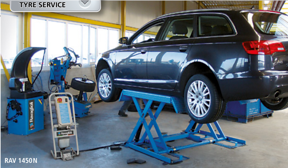
RAV 1450 N